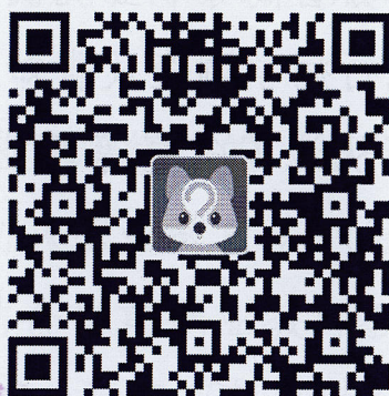
图1 报送回执的二维码

1.请各高职院校代表务必按时参加培训,于6月30日前登录“江苏省高等职业教育教师培训网”(网址: http://spzx.jsut.edu.cn )进行报名(网上报名流程的操作细则详见附件1),同时于7月6日前扫描二维码报送回执,以便于统一安排食宿。